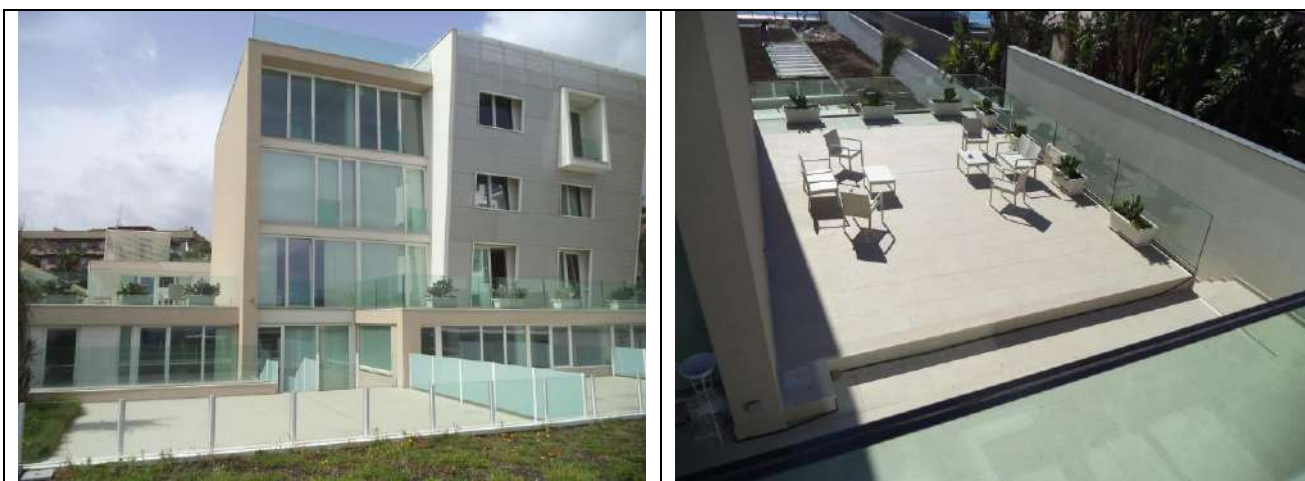
Riquilificazione edificio sito in via ex Messina 170, Catania