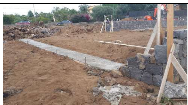
Opere di Urbanizzazione primaria, zona via Carrubazza, San Gregorio di CT (in corso)