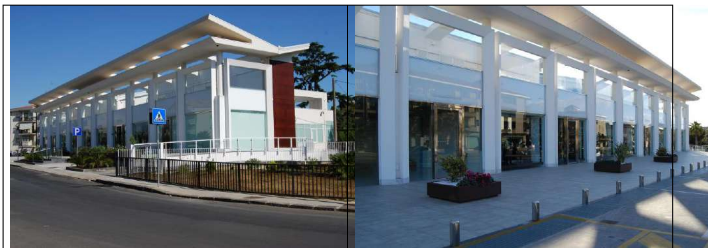
Completamento edificio per locali commerciali ed uffici in viale Europa, Caltagirone