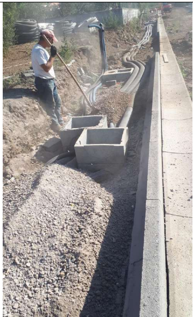
Opere di Urbanizzazione primaria, zona via Giotto, San Gregorio di CT (in corso)