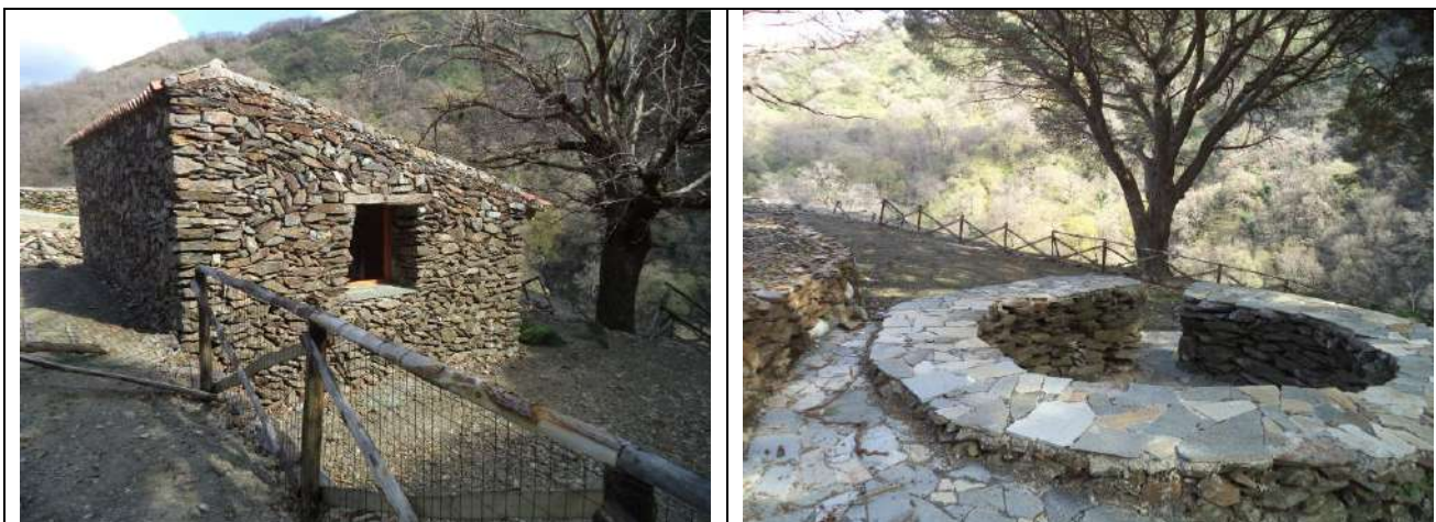
Valorizzazione di contesti paesaggistici della Valle del Nisi e dei Peloritani, Fiumedinisi