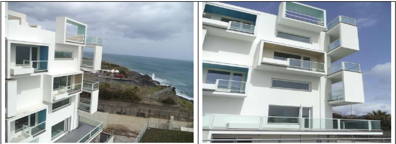
Costruzione Edificio Multipiano per Abitazioni, Viale Africa, Catania