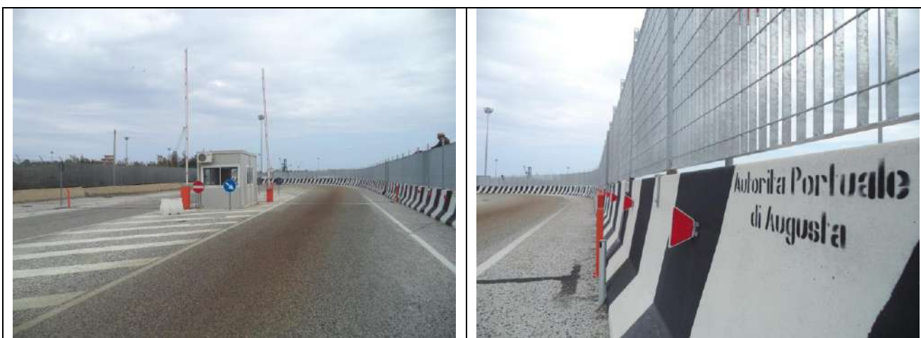
Lavori di recinzione delle aree ro-ro nn 1 e 2 del Porto commerciale di Augusta