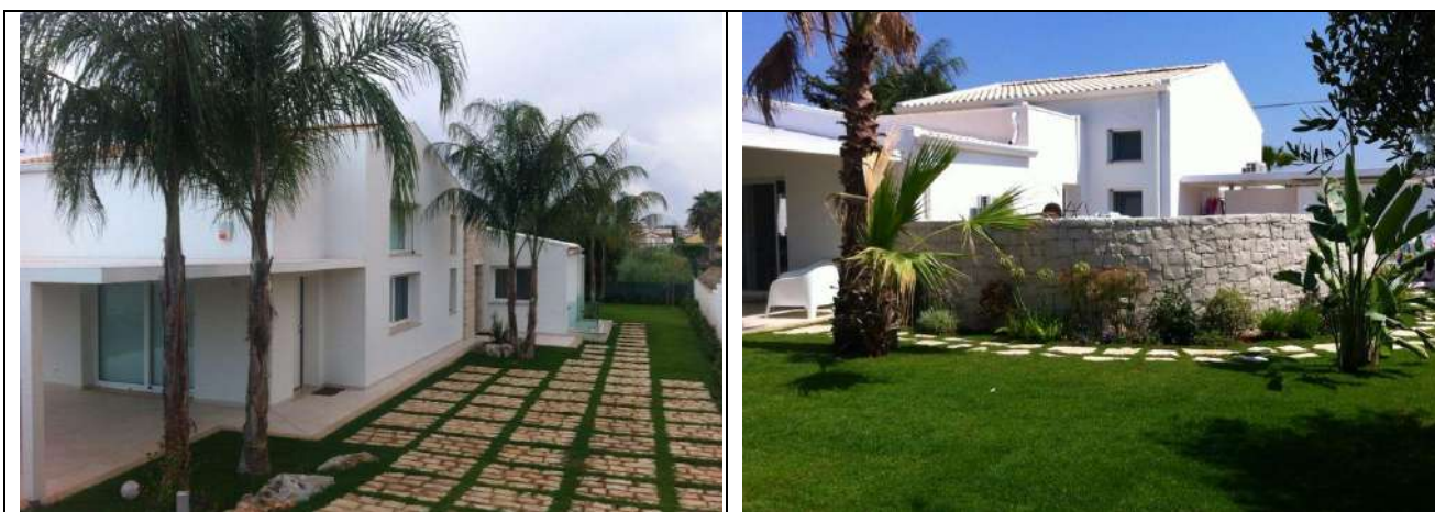
Realizzazione di una villa bifamiliare in località Casuzze, Marina di Ragusa