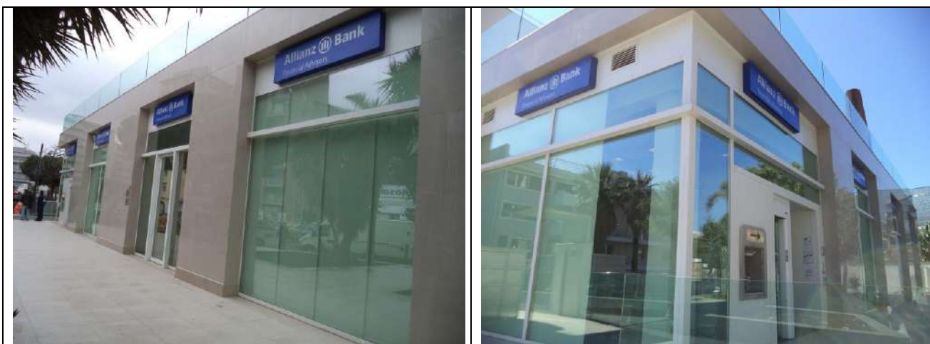
Impianti e ristrutturazione edile, Sportello Bancario, in Viale Africa, Catania